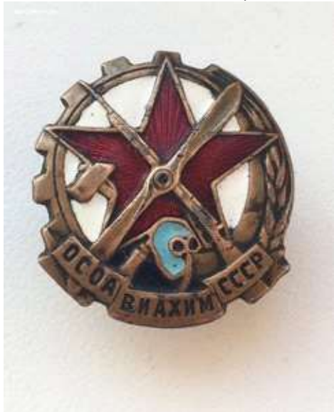
Рис. 8. Членский ОСОАВИАХИМ

За 1938–1939 гг. около 2,5 млн человек сдали нормы ГТО и БГТО.