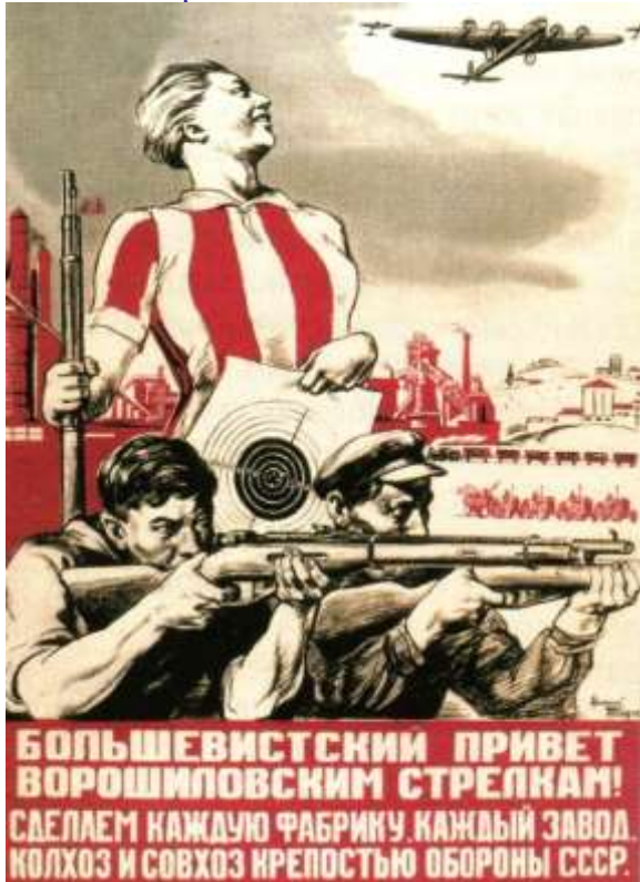
Рис. 7. Советский плакат. Художник Василий Ёлкин.

1939 г. В 1938 г. Сталин говорил, что весь народ необходимо держать в состоянии мобилизационной готовности пред лицом военной опасности (рис. 7).