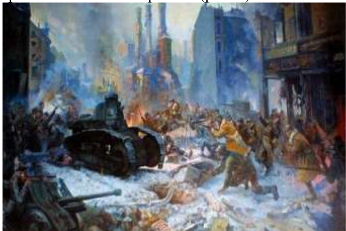
Рис. 3. «Взятие Выборга Красной Армией» А. А. Блинков

11 февраля 1940 г. начался заключительный этап войны. Советские войска перешли в наступление и прорвали линию Маннергейма (рис. 3).