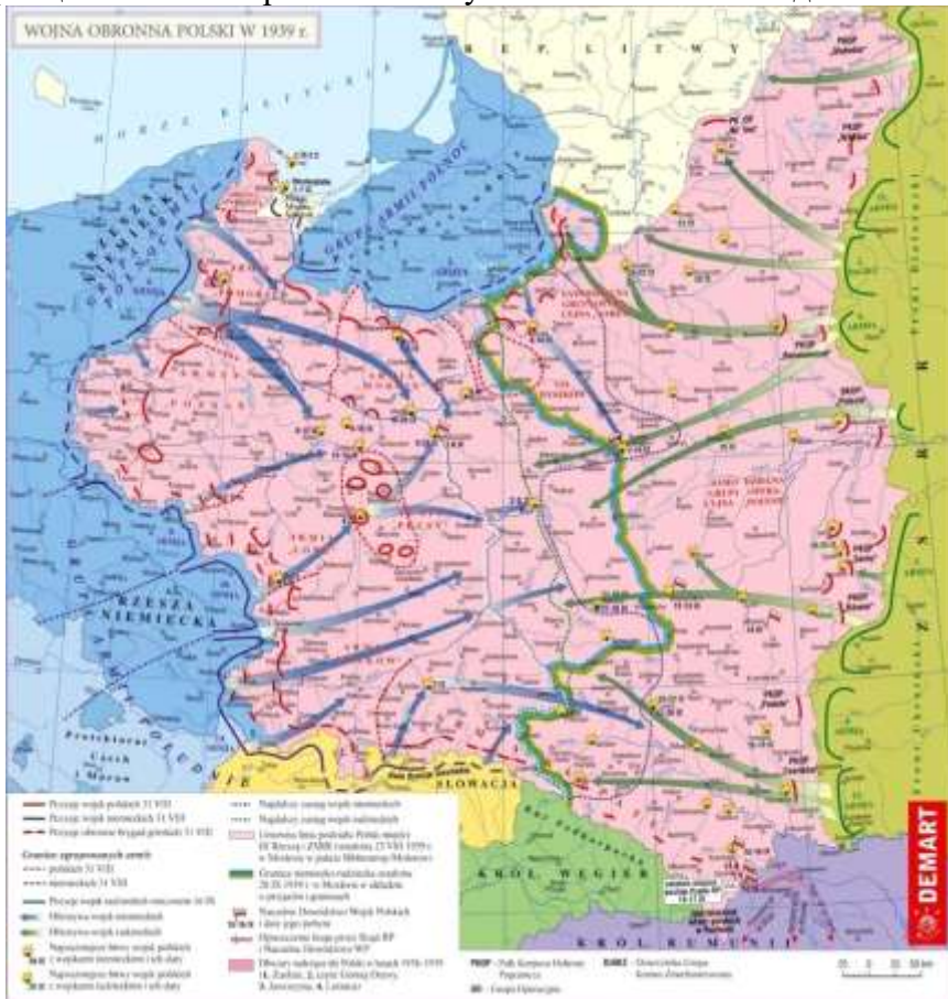
Рис. 2. 1939 г., войскам РККА был разослан приказ № 16633, 16634 о нападении на Польшу 17 сентября

Из опубликованных ныне документов видно, что Советский Союз не вмешивался в происходящее до тех пор, пока сохранялись хотя бы малейшие шансы на то, что Польша сумеет продолжить борьбу, либо на то, что Франция и Великобритания начнут полномасштабные действия против Германии.